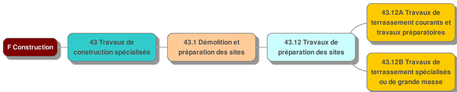
Schéma réalisé avec l'application MindMup